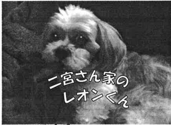
二宮さん家の レオンくん