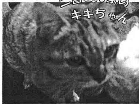
二宮さん家の キキちゃん